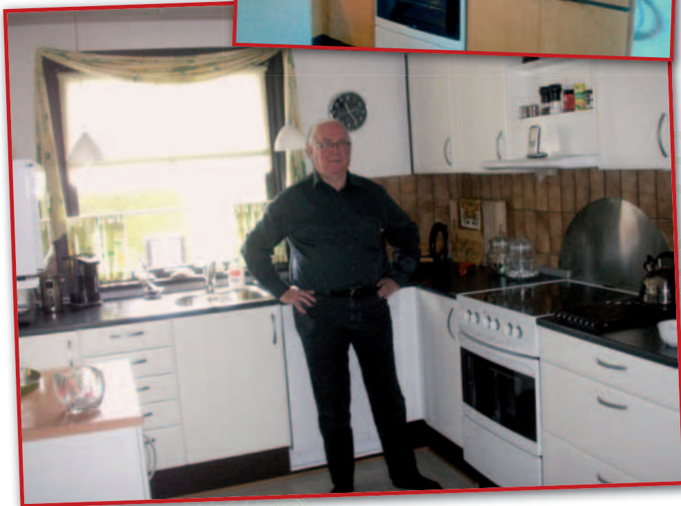
Det nye køkken