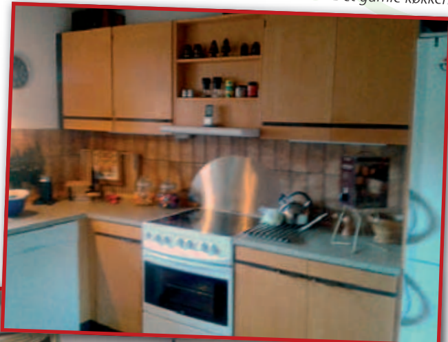
Det gamle køkken

- Der kom to mænd kl. 7.30, og kl. 13.30 var de færdige, det gik helt fantastisk, fortæller ægteparret.