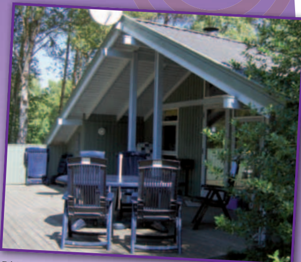
Fritidshuset i Ebeltoft er solgt, fordi det krævede en omfattende renovering.