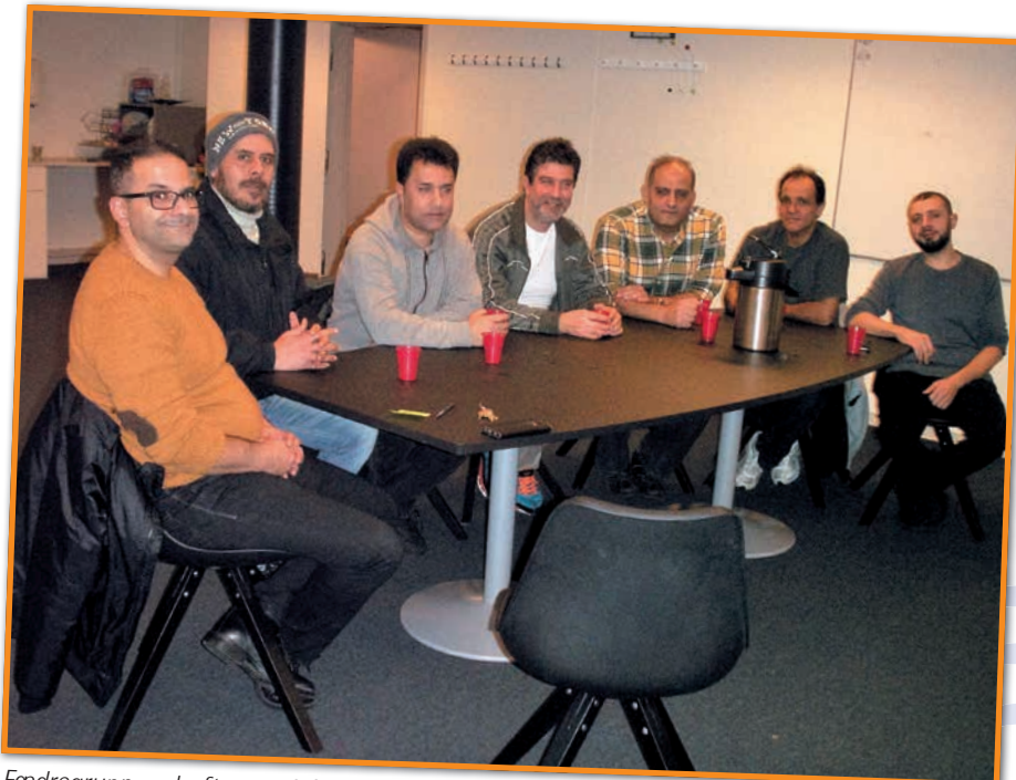
Fædregruppen drøfter nye initiativer.

med, alle er velkommen uanset nationalitet.