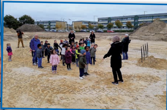
Børn fra børnehaven Ringgården – kommende brugere af det nye Bydelshus – med et festligt indslag med både sang og dans.

Rigtig mange var mødt op for at deltage i festlighederne omkring 1. spadestik.