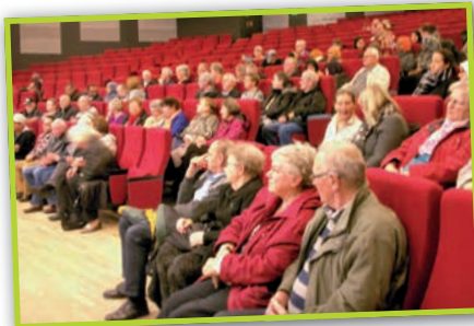
Spørgsmålene var mange da der blev holdt orienteringsmøde om Helhedsplanen for Stengårdsvej.

For udearealets vedkommende var det spørgsmålet om ændringerne af haverne.