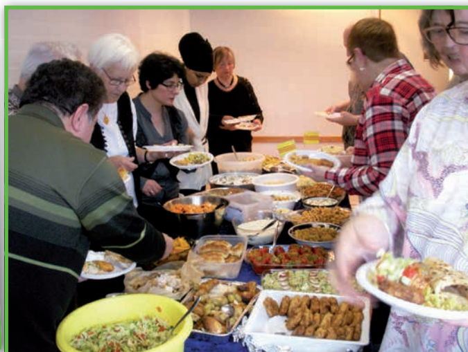
Der var mange spændende etniske retter på den flotte buffet