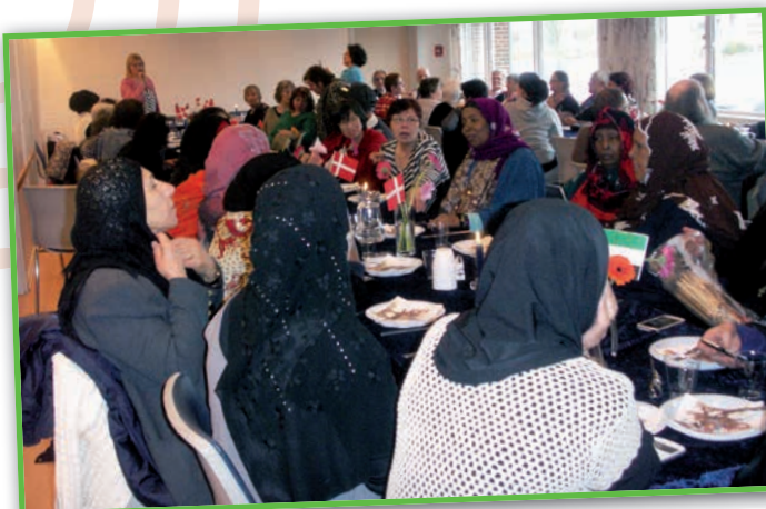
Rigtig mange var mødt op for at deltage i Mosaikkens fødselsdagsfest