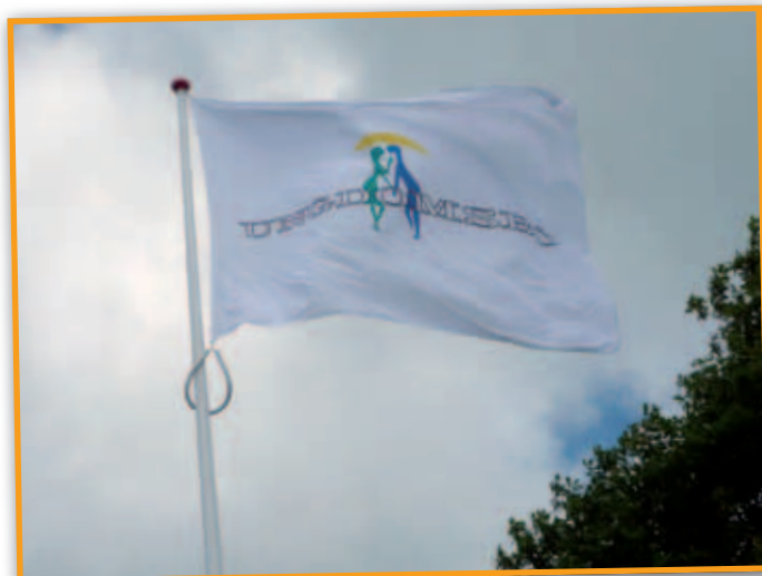
Almindeligt flag i afdeling 21