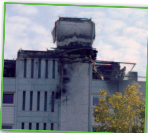
21 familier blev genhuset ved branden på Skolebakken den 22. maj 2012, en tredjedel af dem sidder tilbage med en stor gæld, fordi de ingen indboforsikring havde tegnet.

- Jeg har en liste på hele 4 tætskrevne sider med de ting, der er erstat-