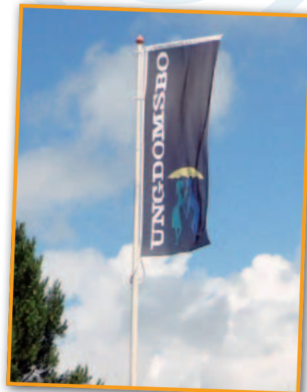
Højkantsflag i sort i afdeling 26/29