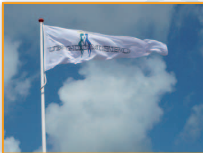
Standerflag i afdeling 40