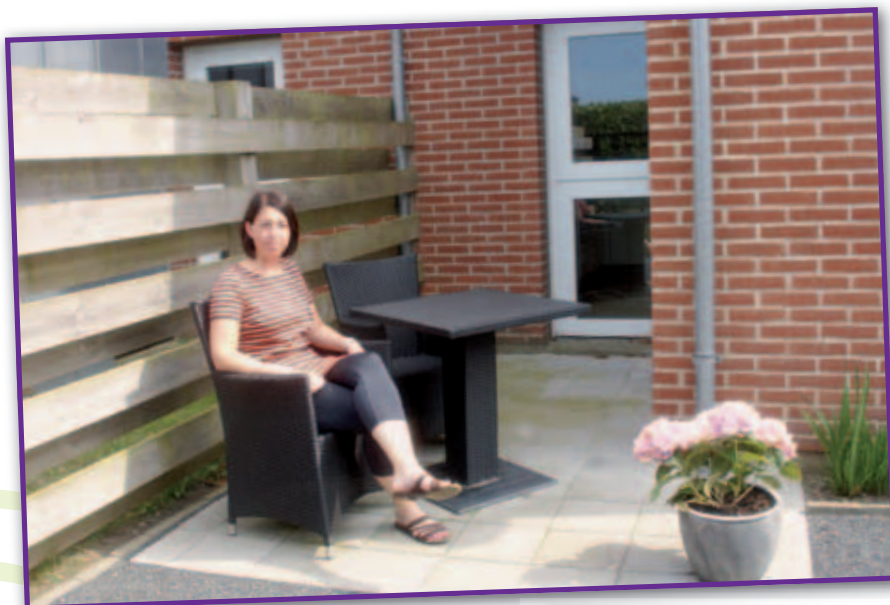
Fliserne i forhaven er lagt om, og pladsen udvidet, så de kan sidde i solen, når aftensmaden spises.

Brugte råderetten og fik meget mere plads og sol i haven