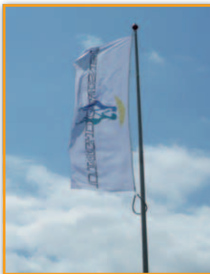
Højkantsflag i hvid i afdeling 9/10

De fire flag er hængt op mandag den 6. juli 2015, og engang i oktober - november vil der så blive taget stilling til, hvilket flag der er mest holdbart.