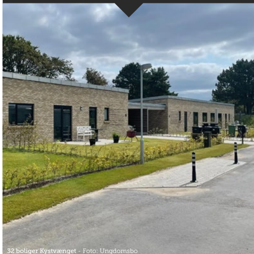
32 boliger Kystvænget

Lokalt til stede med solid fagkompetence